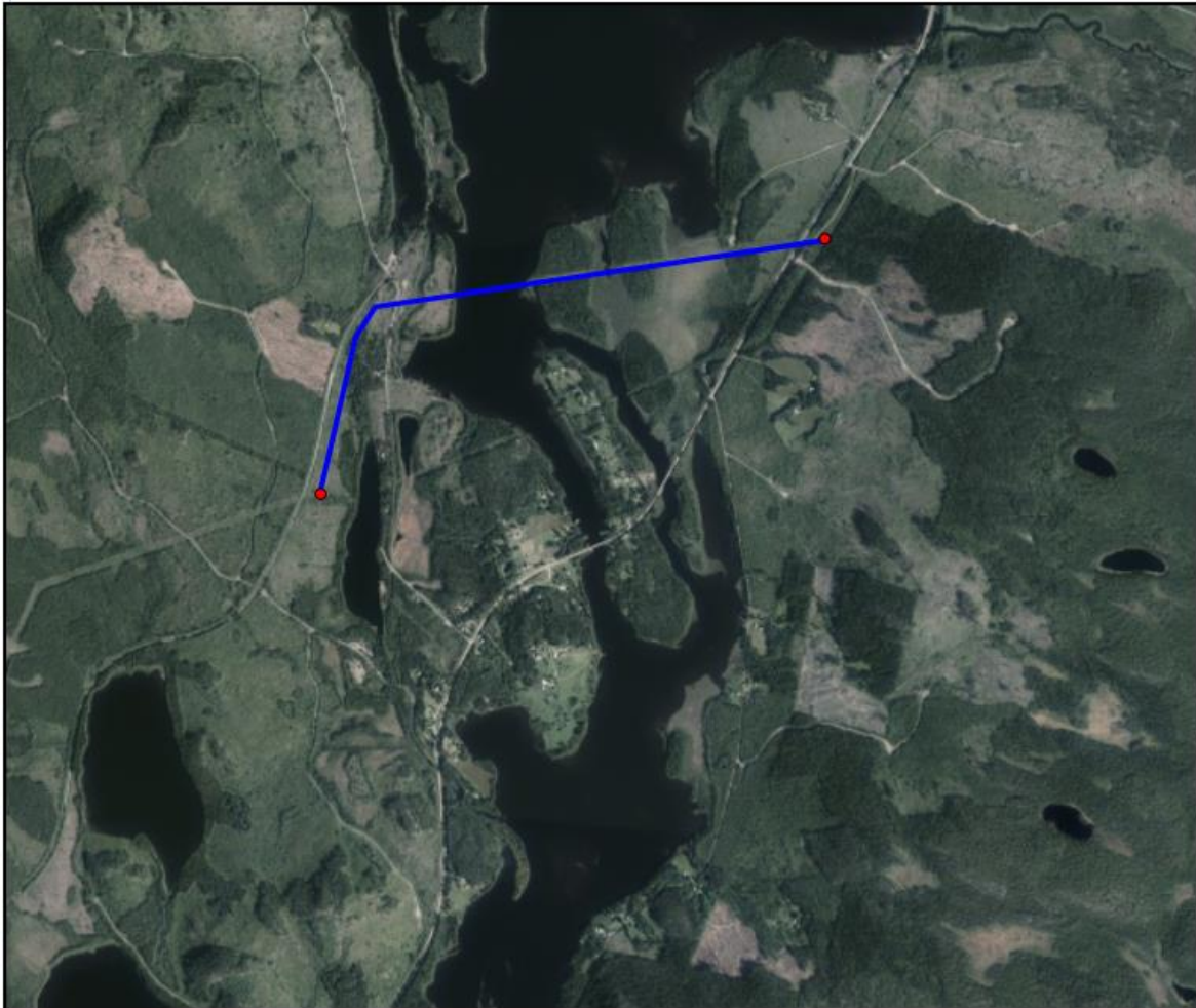
Figur 2: Befintlig luftledning mellan Rojkatjärnen och Bredviksnäset (blå heldragen linje). Röda punkter markerar ändpunkterna på den aktuella ledningssträckan.